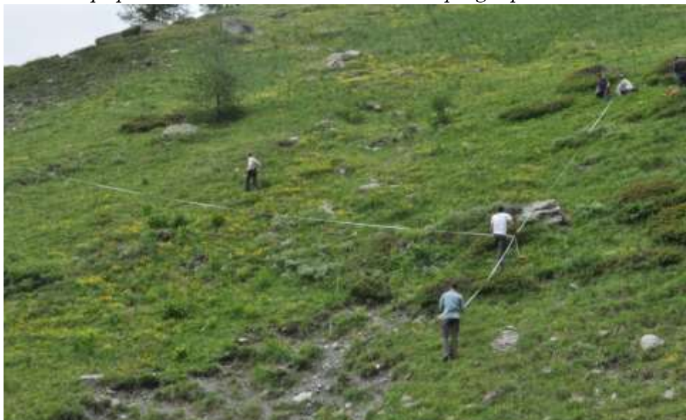
Ristolas, 2016